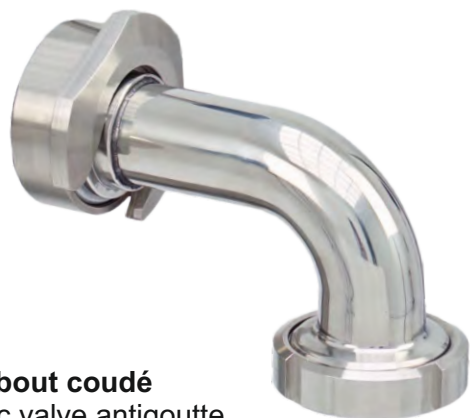
Embout coudé avec valve antigoutte pour remplir bocal et conserves.