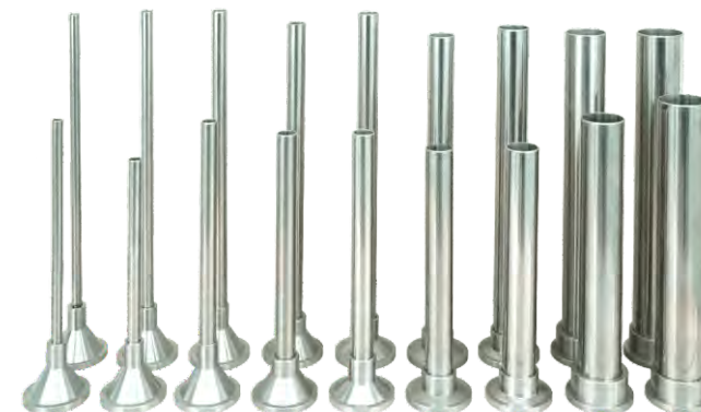
Embouts en acier inoxydable, différentes diamètres et longueurs.