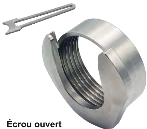
Écrou ouvert porte embout en acier inoxydable avec clef fixation.