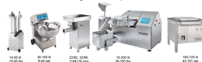
Notre gamme de produits :