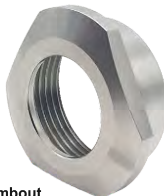
Écrou porte embout en acier inoxydable.